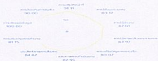
สรุปผลการประเมินการประเมิน ITA